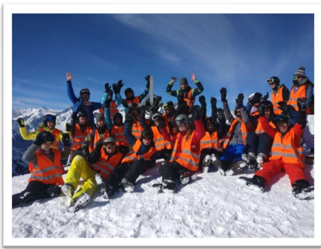
Skifahrt in der Jahrgangsstufe 8 Ahrntal (Südtirol)

Das Betriebspraktikum in der Stufe 10 bietet dann die Möglichkeit, die Berufswirklichkeit und damit einen Teil der Lebenswirklichkeit kennen zu lernen und im außerschulischen Bereich die Sozialkompetenzen zu stärken. Es hat ausdrücklich nicht die Berufsfindung zum Ziel.